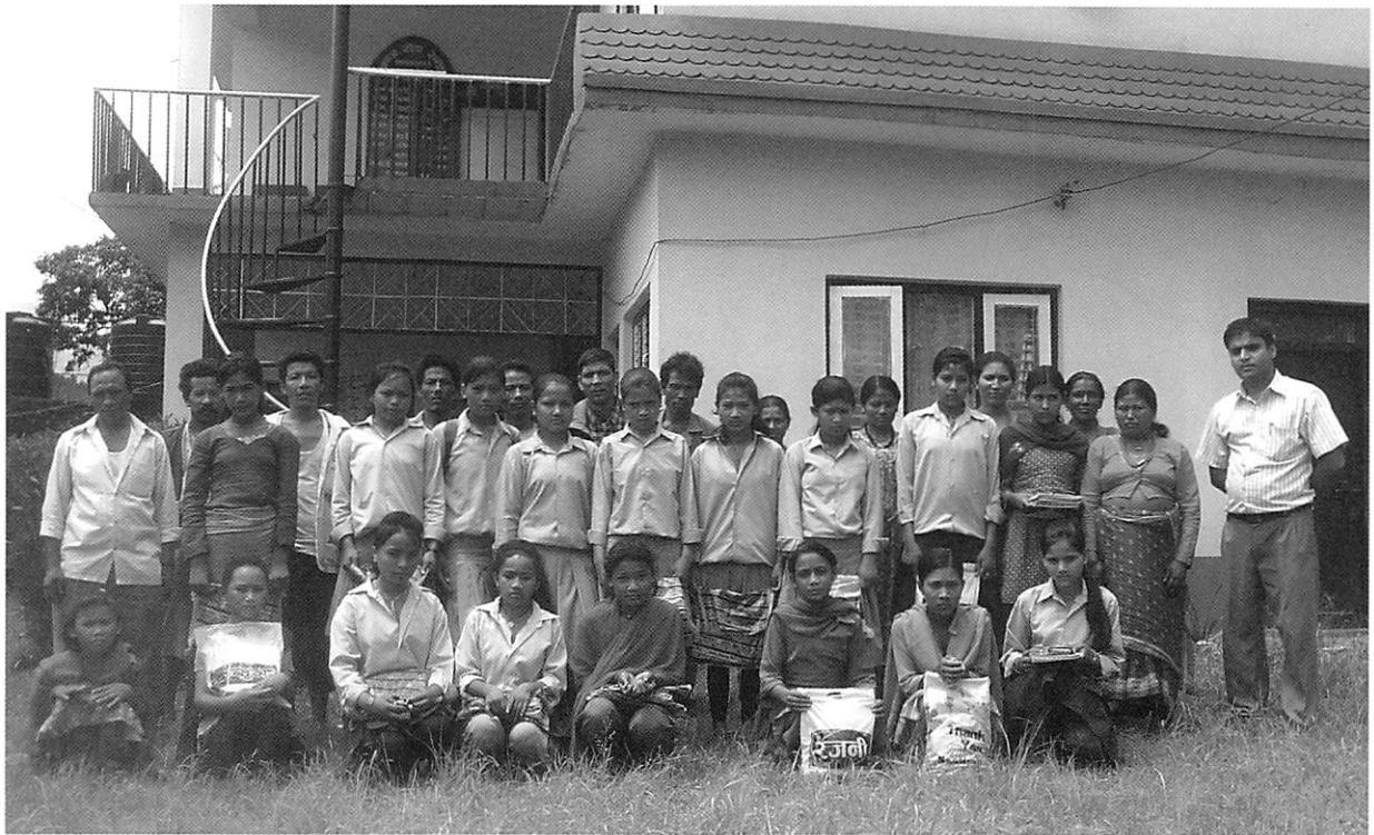
奨学金を受けた女子生徒たちとガハテ村の代表たち

篠山ナマステ会は、セティ ディビ小学校の卒業生が中等 教育で学ぶ機会を得られるよ う、カウンタートパート・SS Sの奨学金制度を支援するこ とを決定し、平成23年度分と して4万円を送金しました。