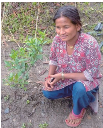
オレンジの苗木を育てています

「フリグラシユ・マヒラサムハ」にはオレ ンジの苗木9本とレモンの苗木1本が提供 された。これらの植物は生き残り、満足の いく成長をしている。