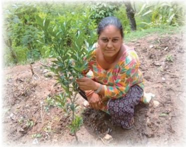
レモンの苗木を 育てています